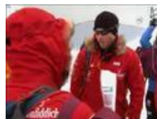
Il principe Harry in Antartide: trekking fino al Polo Sud (23/11/2013)

[an error occurred while processing this directive]