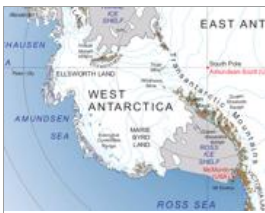
La Terra di Marie Byrd nell'Antartide occidentale

Un vulcano sta nascendo sotto un chilometro e mezzo di calotta glaciale, in un altopiano dell'Antartide occidentale chiamato Marie Byrd Land in cui, prima d'ora, non era stata segnalata attività vulcanica recente. La scoperta, annunciata su Nature Geoscience , ha